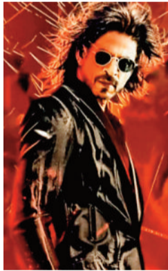
सिद्धार्थ की पोस्ट देख बड़ी उत्सुकता : सिद्धार्थ ने अपने एक्स अकाउंट पर लिखा है, 'टिक टॉक। टिक टॉक।' ये पोस्ट जैसे ही सोशल मीडिया पर वायरल हुआ तो लोगों ने कयास लगाया शुरू कर दिया। एक यूजर ने लिखा, 'टिक टॉक... बैंग बूम... जितना बड़ा #SRKian, उतनी

मुंबई। शाहरुख खान को 2023 में आखिरी बार फिल्म 'डंकी' में देखा गया था। अब उनकी अगली फिल्म 'किंग' का लोगों को बेसबी से इंतजार है। सिद्धार्थ आनंद के निर्देशन में बन रही इस फिल्म की शूटिंग का कुछ हिस्सा अभी बाकी है। इस बीच निर्देशक ने एक रहस्यमयी पोस्ट साझा किया है, जिसने लोगों के दिलों की धड़कनों को तेज कर दिया है। कयास लगाए जा रहे हैं कि बहुप्रतीक्षित फिल्म 'किंग' को लेकर कुछ नया अपडेट आने वाला है।