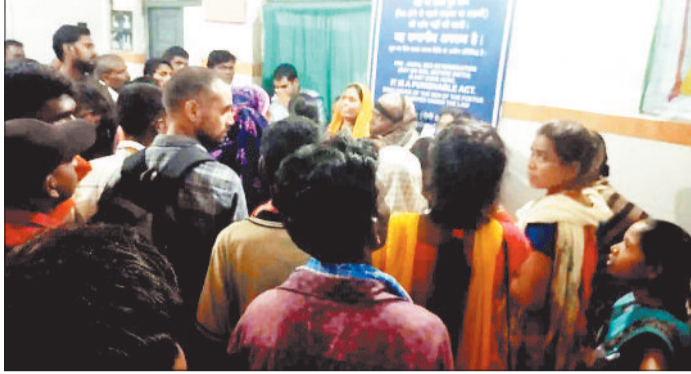
सोनोग्राफी कराने मरीजों की भीड़।

मेडिकल कॉलेज अस्पताल में सोनोग्राफी, सीटी स्कैन व एमआरआई की सुविधा उपलब्ध है। अस्पताल में पर्याप्त जांच के साधन उपलब्ध हैं। खास बात एक रेडियोलॉजिस्ट के भरोसे संचालित है सोनोग्राफी, सीटी स्कैन व एमआरआई