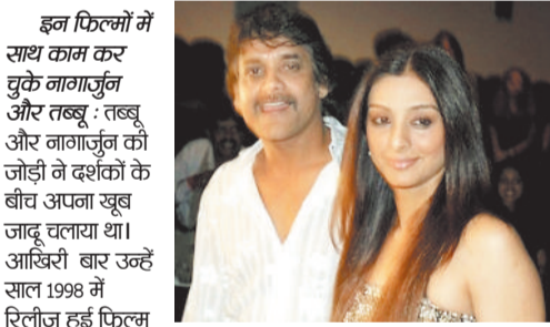
इस फिल्मों में साथ काम कर चुके नागार्जुन और तब्बू : तब्बू और नागार्जुन की जोड़ी ने दर्शकों के बीच अपना खूब जादू चलाया था। आखिरी बार उन्हें साल 1998 में रिलीज हुई फिल्म 'आविदा मैं आविदे' में देखा गया था। उधर नागार्जुन की कॉमेडी फिल्म 'सिस्टरो' में तब्बू ने कैमियो किया था।

फिल्म में बेहद अहम भूमिका निभाएंगी तब्बू : रिपोर्ट के मुताबिक, तब्बू से जब इस फिल्म के लिए संपर्क किया गया तो उन्होंने भी इसमें दिलचस्पी दिखाई। उन्हें फिल्म की स्क्रिप्ट और इसमें अपना किरदार पसंद आया है। इस फिल्म में तब्बू के साथ नागार्जुन को रोमांस करते नही देखा जाएगा, बल्कि उन्हें इसमें एक महत्वपूर्ण भूमिका के लिए साइन किया गया है। तब्बू और नागार्जुन परदे पर पहले भी धमाल मचा चुके हैं। ऐसे में ये फिल्म उनके प्रशंसकों के लिए किसी तोहफे से कम नहीं।